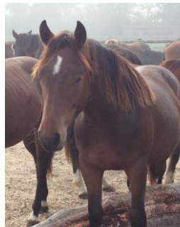
Neymar Freiberger Jahrgang 2015