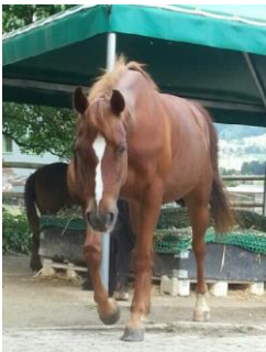
Smarty Quarter Horse Jahrgang 2000